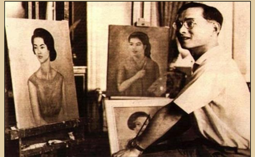
ภาพวาดฝีพระหัตถ์

แนวทางของจิตรกรรมฝีพระหัตถ์ที่โดดเด่นและทรงเลือกถ่ายทอดอยู่เสมอเป็นลักษณะของศิลปะสมัยใหม่ (Modern Art) ซึ่งเน้นเรื่องการแสดงออกทางอารมณ์สูงมากโดยเฉพาะจิตรกรรมฝีพระหัตถ์ทั้งภาพเหมือนจริง ภาพบุคคล อิมเพรสชันนิสม์ เอ็กซเพรสชันนิสม์ ซิมโบลิสม์ ฯลฯ ซึ่งแนวทางของศิลปะสมัยใหม่ ทรงโปรดปรานดนตรีแจ๊สที่เต็มไปด้วยอิสระภาพในการบรรเลงเสรีภาพนั้นก็ส่องทางมาถึงจิตรกรรมที่ทรงวาดเช่นกัน