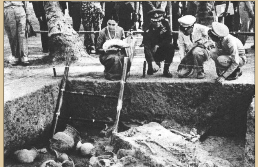
ทอดพระเนตรหลุมขุดค้นที่แหล่งโบราณคดีบ้านเชียง จ.อุดรธานี เมื่อ พ.ศ. 2515

“...โบราณวัตถุ ศิลปวัตถุ และโบราณสถานทั้งหลายนั้น ล้วนเป็นของมีคุณค่า และจำเป็นแก่การค้นคว้าในทาง ประวัติศาสตร์ ศิลปะและโบราณคดี เป็นเครื่องแสดงความเจริญรุ่งเรืองของชาติไทยที่มีมาแต่อดีตกาล สมควรที่จะสงวนรักษาให้คงทนถาวรเป็นสมบัติส่วนรวมของชาติไว้ตลอดกาล โดยเฉพาะโบราณวัตถุและศิลปวัตถุควรจะได้มีพิพิธภัณฑ์สถาน เก็บรักษาและตั้งแสดง นักศึกษาและประชาชนได้ชมและศึกษาหาความรู้ให้มากและทั่วถึงยิ่งกว่าที่เป็นอยู่ในขณะนี้...”