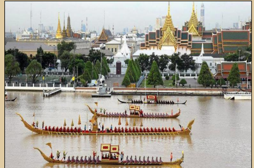
ขบวนพยุหยาตราทางชลมารค